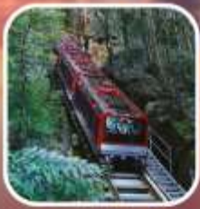
อุทยานบลูเมาท์เท็นส์