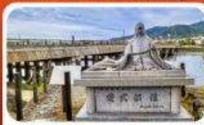
สะพานอูจิ