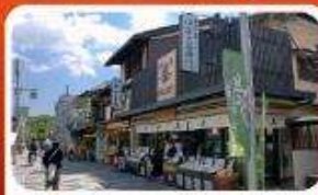
ช้อปปิ้งถนนสายชาเขียว