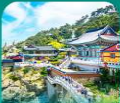
วัดแฮดงกุงซา

เที่ยวปูซานแบบแกรนด์ แกรนด์ ทั้งสายอาร์ท สายบู และสายช้อปปิ้ง • เขิกจันบนท่าฮงซุคศิลปะเลอร์ฟลา ที่ท่าเรือจินบี (BUSAN BUNEZIA) เดินเล่นหมู่บ้านคิมซอน ซาซโดริมีแห่งปูซานสุดน่ารัก พลาดไม่ได้กับการนั่งรถไฟปูซาน • เสริมสิริมงคลที่วัดแฮดงกุงซา วัดริมทะเลชื่อดัง พร้อมช้อปปิ้งที่ลิตเติ้ลพีร์เนียมเจ้าทีลิต และตลาดบันโพคง ก่อนปิดท้ายด้วย ย่านวีฮงซุคซิก ซอ มยอง ออเนิว พร้อมชมวิวสะพาน ควังอินยามค่าขึ้นสุดโรแมนติก