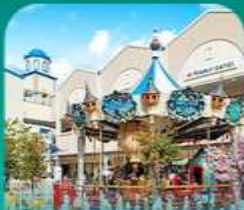
ลิตเติ้ล เอ้าท์เล็ต