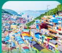
หมู่บ้านดัมซอน