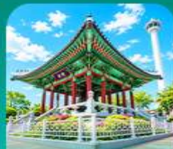
สวนเขาดูซาน