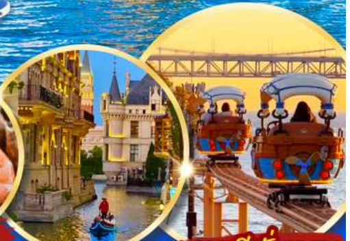
เมืองน้ำเวนิส