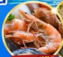
อาหารซีฟู้ด