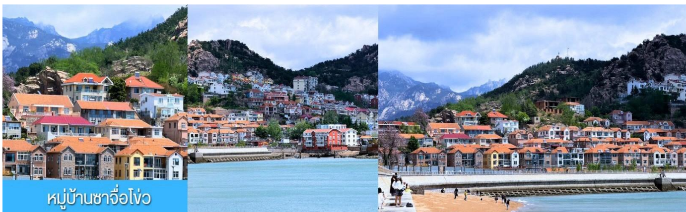
หมู่บ้านชาวโจว