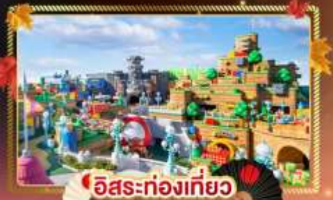
อิสระท่องเที่ยว