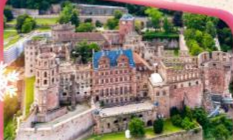
ปราสาทโฮเดลเบิร์ก