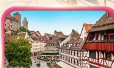
สัมปัสเมืองเก่าบูเรมเบิร์ก