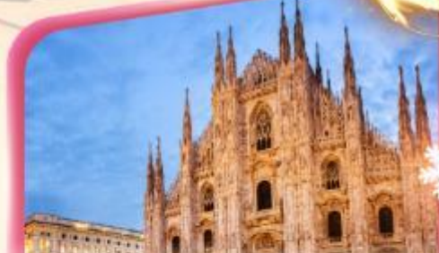
คูโอโมมิลาโน