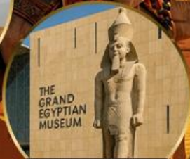
THE GRAND EGYPTIAN MUSEUM