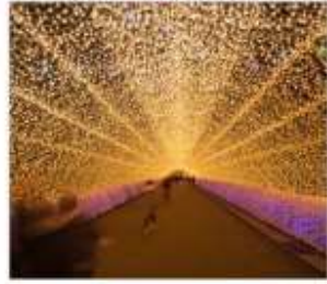
นาบะนะโนะซาโตะ