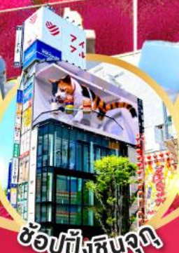
ซ้อปั้งชินจุกุ