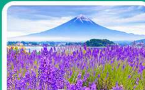
สวนโออิชิพาร์ค