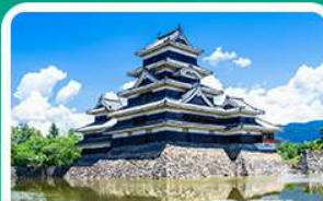
ปราสาทมัตสึโมโด้