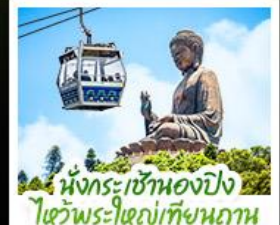
นั่งกระเช้าเองปีง ไหว้พระใหญ่เทียนถาน