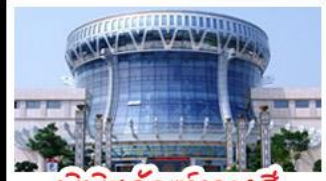
พิพิธภัณฑ์ทิวาสี

สวนสนุก FANTASYLAND - หมู่บ้านสไตล์ยุโรป พิพิธภัณฑ์ทิวาสี - ถนนคนเดินสามตรอกสองซอย ท่าเรือกิ่งจ้อ - ศาลเจ้าแม่กวนอิมพันกร เมนูพิเศษ อาหารทิวาสี, สุกีชาบูหม่าล่า