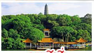
ภูเขาชิงชิว