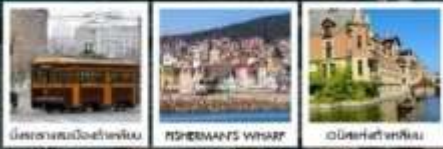
นั่งรถชมทะเลต้าเหลียน