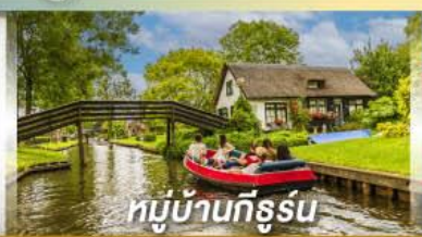
หมู่บ้านทึร์รูน