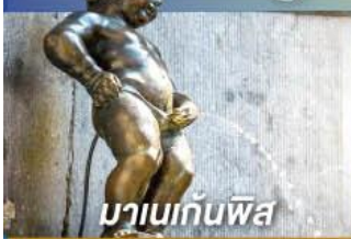
มานเนกันพิส