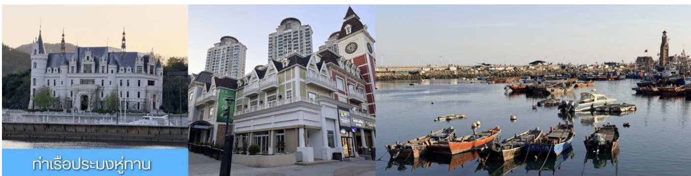
ท่าเรือประมงหู่ทาน

หลังอาหารเช้า นำท่าน เที่ยวชม ท่าเรือประมงหู่ทาน 大连渔人码头 เป็นจุดเช็คอินที่โดดเด่นด้วยสถาปัตยกรรมสไตล์ยุโรปสีสันสดใส ผสมผสานกลิ่นอายเมืองท่าดั้งเดิมเข้ากับบรรยากาศสุดโรแมนติกที่เต็มไปด้วยเรือประมง คาเฟ่ ร้านอาหาร และจุดชมวิวยามทะเล