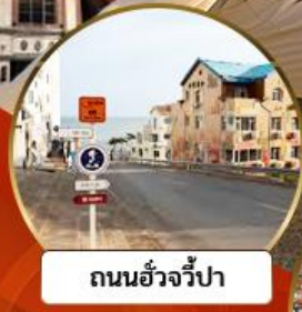
ถนนอ่าวจีป่า