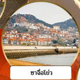
ซาจี้โข่ว