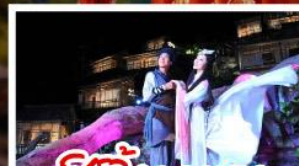
ชีวิตจิ้งจอกขาว