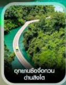
อุทยานชิงจื่อทวน ด่านสิงโต