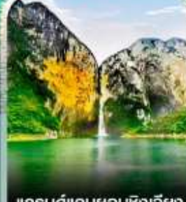
แกรนด์แคนยอนชิงเจียง