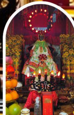
วัดเจ้าแม่กวนอิมอ่องฮำ

เสริมโชคลากนำความรุ่งเรืองทุกด้านของชีวิต