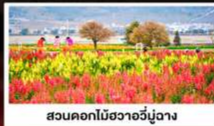
สวนดอกไม้ฮวงอวี่มู่ฉาง