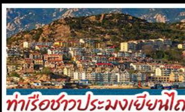
ท่าเรือชาวประมงเยียนโก