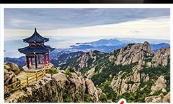
ภูเขาเลาซาน