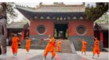
ชมโชว์กังฟูเส้าหลิน

*ทางบริษัทฯ ขอสงวนสิทธิ์ในการสลับโปรแกรมทัวร์ตามความเหมาะสมขึ้นอยู่กับสถานการณ์ประจำวัน โดยคำนึงถึงผลประโยชน์ของลูกค้าเป็นสำคัญ