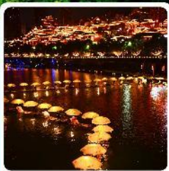
เมืองเซียนอัน