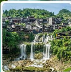
ฟู่หลงจีน

• โฮลท์ อุกยานเทียนเหมินซาน หุบเขาวงกต เมืองโบราณเซียนอัน หมู่บ้านโบราณฟู่หลงจีน ภูเขาโรซ่าอู๋จียโต อุกยานชื่อจื่อควนด่านสิงโต