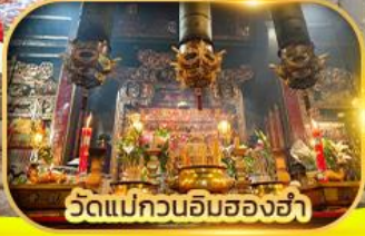
วัดแม่กวนอิมฮองฮำ