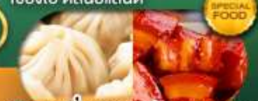
พิเศษ เสี้ยวหลงเป่า หมูคังพอ เดินทาง ม.ค. - มิ.ย. 69