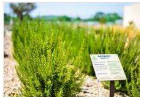
The Mediterranean Garden