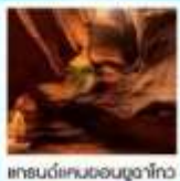
แกรนด์แคนยอนยูลาโกว