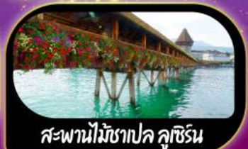
สะพานไม้ฆาปค คูซิริน