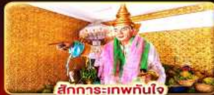
สิทธิการ:เทพทันใจ