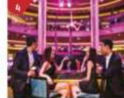
Bar 360 Catch live music and aerial acrobatic performances with a glass of champagne.