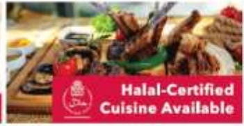
Halal-Certified Cuisine Available