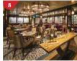
Bistro By Mark Best Relish contemporary Western cuisine from the internationally-acclaimed Australian chef.