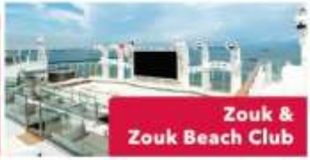
Zouk & Zouk Beach Club