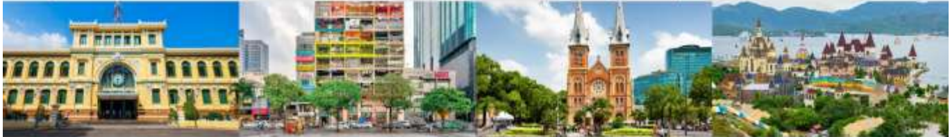
ไบรณีย์กลางโฮจิมินห์