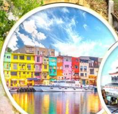
ท่าเรือสายรุ้ง