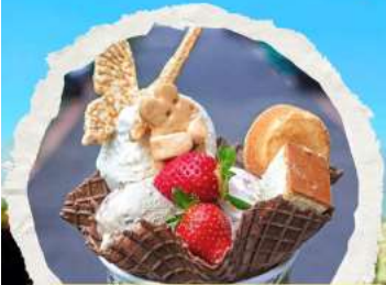
ร้าน ไอศกรีมมิยาฮาระ