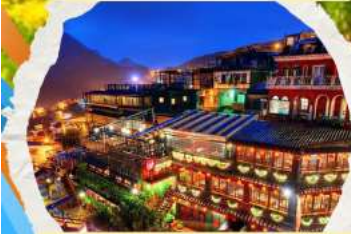
หมู่บ้านโบราณฉิวเฟิง