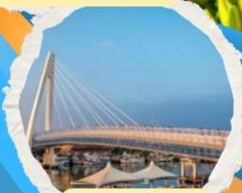
สะพานตงสู่ย