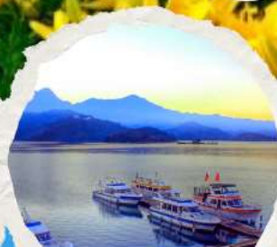
ทะเลสาบสุริยขึ้นจินทารา