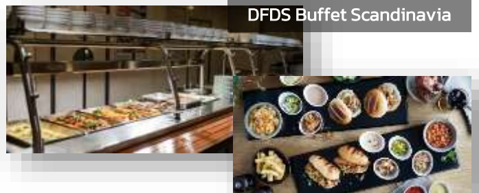
DFDS Buffet Scandinavia

ค่ำ บริการอาหารค่ำแบบบุฟเฟ่ต์ ณ ห้องอาหารของเรือ DFDS