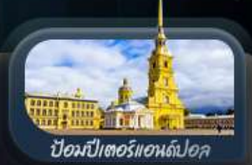
ปิอปปิเตอร์แอนดโปล