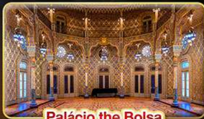
Palácio the Bolsa