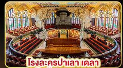
โรงละครปาลาเลา เดลา มุสิก้า คาคาลานา