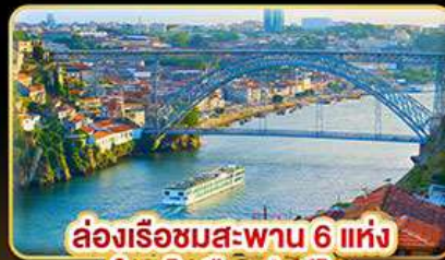
ล่องเรือชมสะพาน 6 แห่ง ในคูโรเมืองปอร์โต