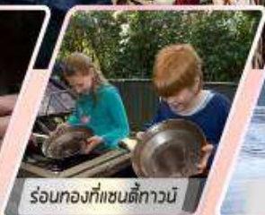
ร้อนทองที่แซนดีทาวน์