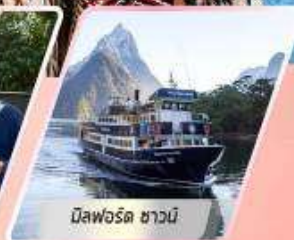
มิลฟอร์ด ซาวน์