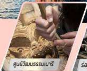
ศูนย์วัฒนธรรมมาเรีย