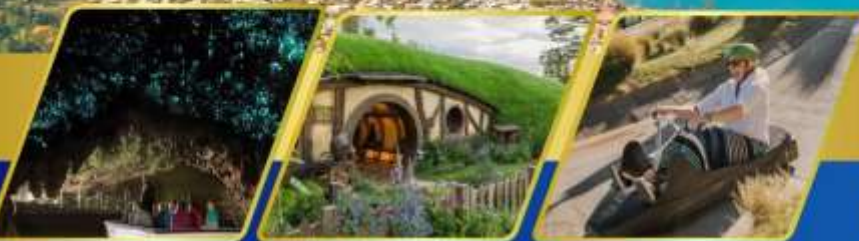
ถ้ำหอนเรื่องแสง