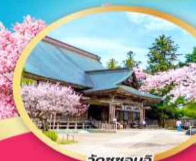
วัดชูซอนจิ