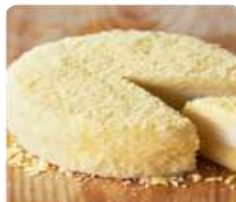
ร้าน LeTAO ร้านนี้มีเค้กแสนอร่อย ด้วยบรรยากาศที่ร้านตกแต่งด้วยไม้ที่แสนอบอุ่น อีกทั้งยังมีเค้กแสนอร่อยแบบโฮมเมดอีกด้วย