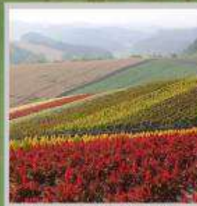
"SHIKISAI NO OKA"