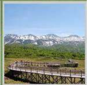
"SHIRETOKO 5 LAKES"