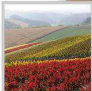
"SHIKISAI NO OKA"