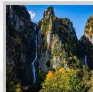
"GINGA & RYUSEI FALLS"

ต้นตอ "ทุ่งดอกพืชมอส ณ สวนดอกชิบะซากุระ-อิงะชิโมะโคะโคะ" ด้วยพรมสีชมพูที่มีพื้นที่ขนาดใหญ่ถึง 100,000 ตารางเมตร ชม "ทะเลสาบคาบสมุทรชิเรโตโกะ" เกิดมาจากการระเบิดของภูเขาไฟโอเอและน้ำพุใต้ดิน จนเกิดเป็นทะเลสาบทั้ง 5 ของชิเรโตโกะ "ฟาร์มสุนัขจิ้งจอกฮอกไกโด" ฟาร์มสุนัขจิ้งจอกแห่งเดียวของเกาะฮอกไกโด สายพันธุ์ท้องถิ่นคือ สายพันธุ์ Ezo red fox เพลิดเพลินกับ "เนินสีฤดู" เนินเขากว้างใหญ่ที่มีดอกไม้ไม้บานาพันธุ์นับ 30 ชนิดปลูกเรียงรายสลับสีกันเป็นแนวยาว นำท่าน "นั่งกระเช้าภูเขาคุโรดะเคะ" เชื่อมจากเชิงเขาของเมืองโซอุนเคียวถึงยอดเขาคุโรดะเคะที่มีความสูงถึง 670 เมตร ไฮไลท์ "ส่องเรือราอูสี ชมความงามของวาฬเพชรฆาต" บริเวณคาบสมุทรชิเรโตโกะ มรดกโลกทางธรรมชาติของฮอกไกโด