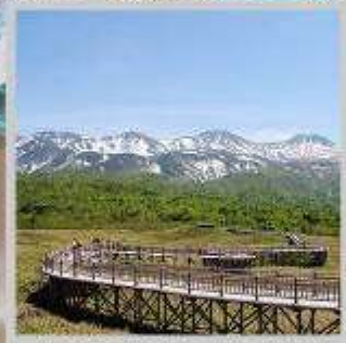
"SHIRETOKO 5 LAKE"