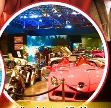
Royal Automobile Museum