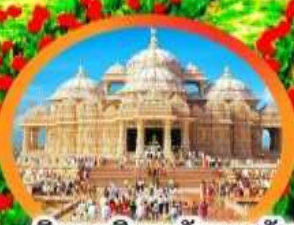
วิหารอินดูอัชมาดัม