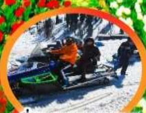
ขี่ SNOW MOBILE