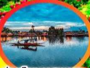
ล่องเรือทะเลสาบดาล