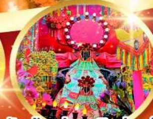
วัดเจ้าแม่กวนอิมฮองอ่า