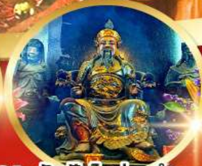
วัดปึกไคฮองอ่า