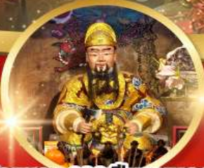
วัดเซกง 600 ปี หยุทหลง