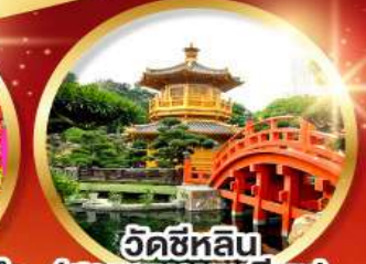
วัดซีหลิน