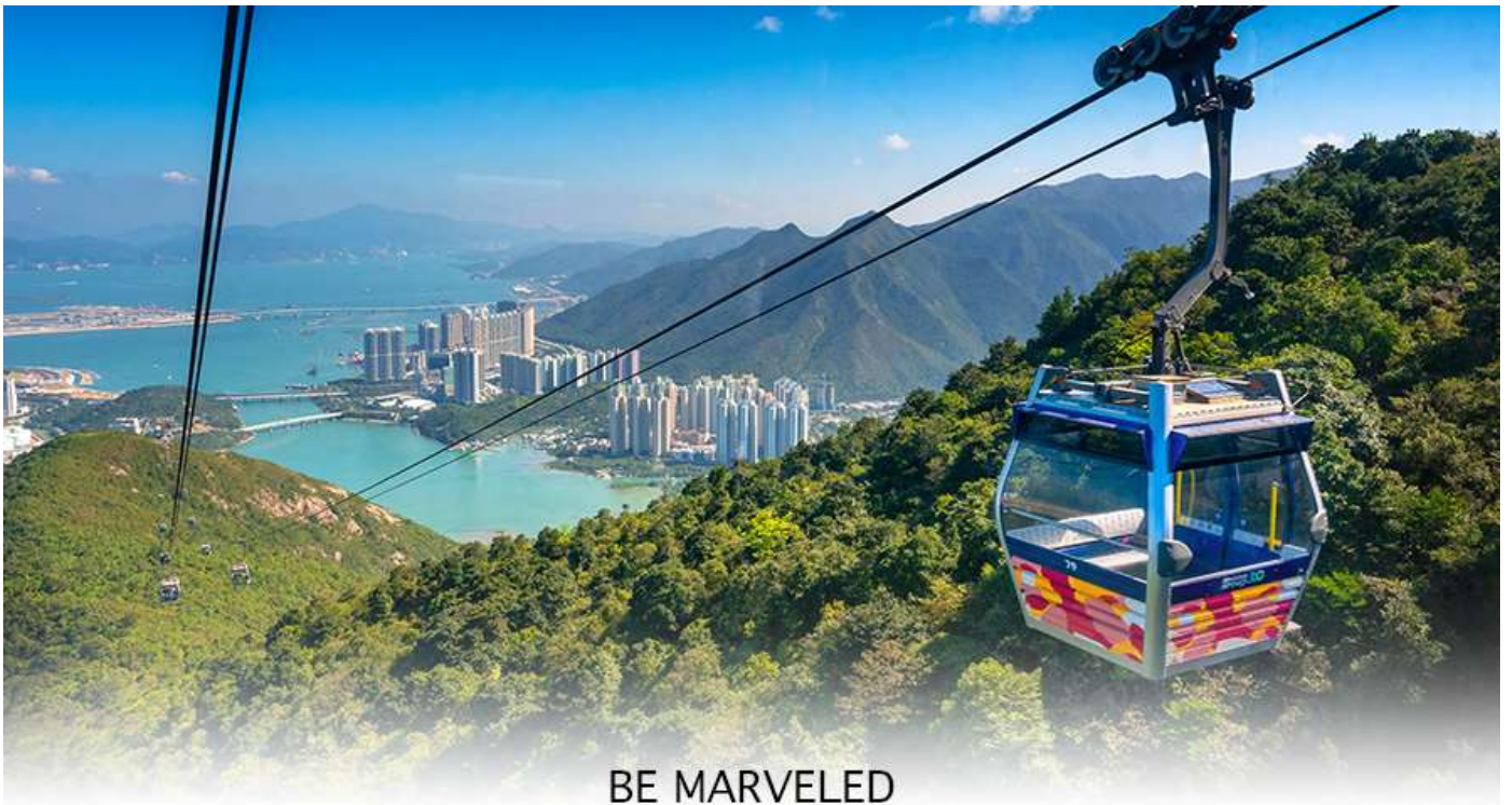
BE MARVELED กระเช้านองปิง

ล่าง ซึ่งการเดินทางขึ้นไปยังสักการะองค์พระใหญ่อย่างใกล้ชิดนั้น ต้องเดินขึ้นบันได จำนวน 268 ขั้นและได้รับเลือกให้เป็นสิ่งมหัศจรรย์ทางวิศวกรรมขั้นที่ 4 จากทั้งหมด 10 ชั้นของฮ่องกงในปี ค.ศ. 2000 ถือเป็นพระพุทธรูปองค์ใหญ่ที่เป็นสุดยอดของประติมากรรมทางพุทธศาสนาที่มีการผสมผสานระหว่างศิลปะสำริดแบบดั้งเดิมกับเทคโนโลยีสมัยใหม่ ชาวฮ่องกงเชื่อว่าหากใครได้มานมัสการขอพรองค์พระใหญ่แห่งนี้แล้ว ชีวิตก็จะมีแต่ความโชคดี มีความสุขสมหวัง และประสบความสำเร็จในทุกๆด้าน หลังจากไหว้พระแล้วท่านสามารถเลือกซื้อของฝาก, ของที่ระลึก จากหมู่บ้านนองปิง อาทิเช่น หยก ไข่มุก หรือเครื่องประดับคริสตัล เพื่อเป็นของที่ระลึก จากนั้นนั่งกระเช้ากลับลงมายังสถานีคองซุง