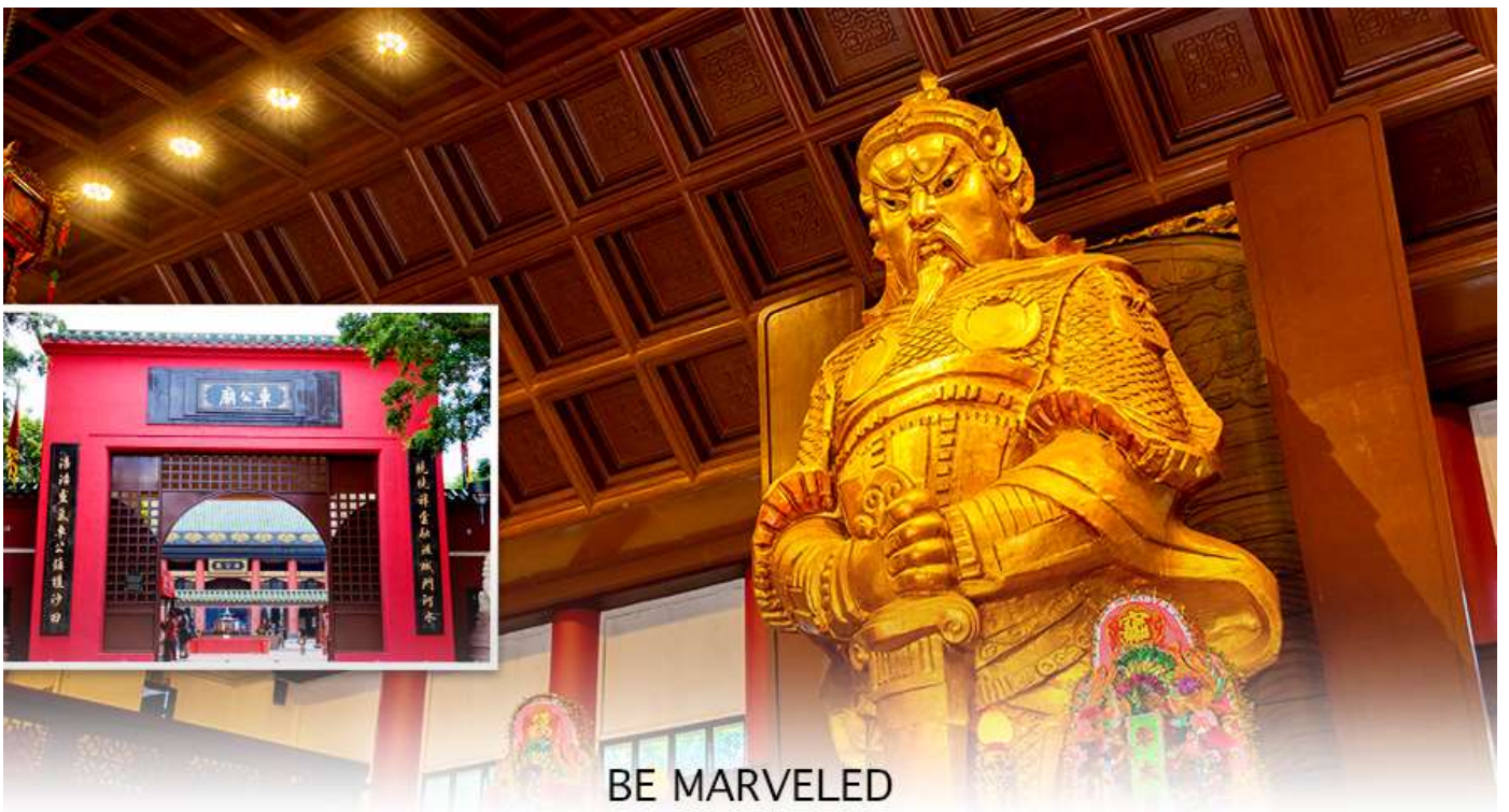
BE MARVELED วัดแชกง

นำท่านเดินทางสู่ วัดแชกงหมิว หรืออีกชื่อหนึ่งว่า “วัดกังหันลม” โดยมีสัญลักษณ์เป็นกังหันนำโชค สร้างขึ้นเพื่อรำลึกถึงท่านแชกงองค์เก่าแก่ มีอายุกว่า 300 ปี ตั้งอยู่ในเขต SHATIN ให้ท่านได้จุดธูปขอพร ลักการะ เทพเจ้า แชกง เป็นอีกหนึ่งวัดที่มีประวัติศาสตร์อันยาวนาน มีตามตำนานเล่ากันว่าได้มีโจรสลัดต้องการที่จะมาปล้นชาวบ้าน เมื่อนายพลแชกงรู้เข้าก็ได้บอกให้ชาวบ้านปักกังหันลมแล้วนำไปติดไว้ที่หน้าบ้าน ปรากฏว่าโจรสลัดได้จากไปและไม่ได้ ทำการปล้น ชาวบ้านจึงมีความเชื่อว่ากังหันลมนั้นช่วยขจัดสิ่งชั่วร้ายที่กำลังจะเข้ามา และนำพาสิ่งดีๆ มาสู่ตน จึงได้ สร้างวัดแชกงแห่งนี้ขึ้น เพื่อระลึกถึงนายพลแชกง และเป็นที่พักการบูชาเพื่อไม่ให้มีสิ่งไม่ดีเกิดขึ้น โดยจะมีวิธีการไหว้ คือ ตั้งจิตอธิษฐานด้านหน้าองค์เจ้าพ่อแชกง จากนั้นให้ท่านหมุนกังหัน จะมีกังหัน 4 ใบพัด แต่ละใบหมายถึงพร 4 ประการ คือ เดินทางปลอดภัย, สุขภาพแข็งแรง, สมความปรารถนา, และ โชคลาภเงินทอง เชื่อกันว่าหากหมุนครบ 3 รอบและตีกลอง 3 ครั้ง ถือว่าเป็นการช่วยหมุนปัดเป่าเอาสิ่งร้ายและไม่ดีออกไปให้หมด และนำพาสิ่งดีๆ เข้ามาแทน