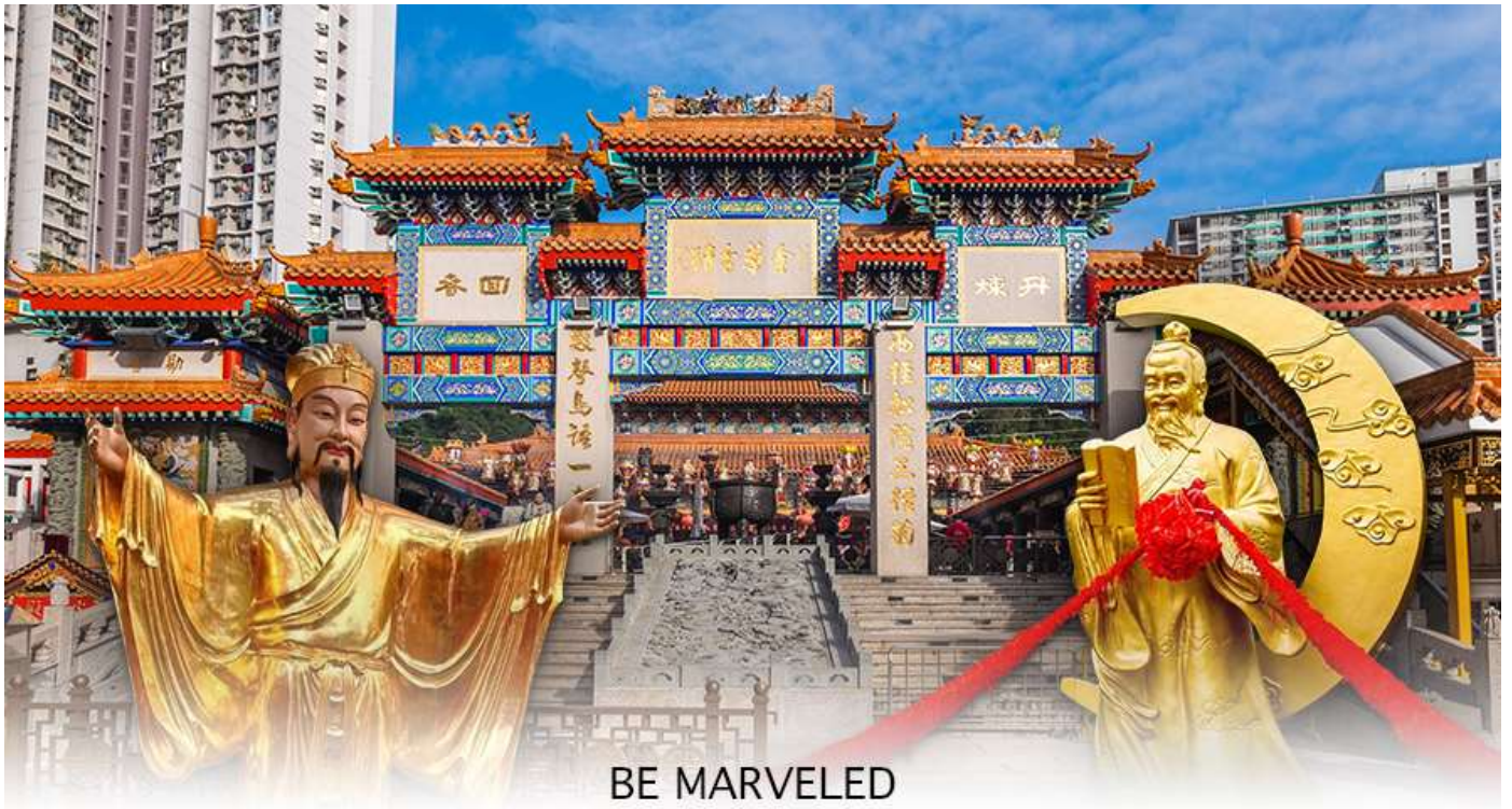
BE MARVELED วัดหวังต้าเซียน

พระหวังต้าเซียน หรือที่รู้จักกันในชื่อ ฮวงซูปิง (Huang Chu-ping) ในช่วงประมาณศตวรรษที่ 4 ได้เดินทางจากเมืองจินมาเผยแผ่ศาสนาในฮ่องกง และสร้างวัดแห่งนี้ขึ้นมาเมื่อประมาณปีค.ศ. 1921 ค่ะ ภายในวัดจะมีทั้ง เทพเจ้าหวังต้าเซียน, เจ้าแม่กวนอิม, เจ้าที่, เทพเจ้าหยุกโหลว (เทพเจ้าแห่งความรัก), ท่านขงจื้อ ซึ่งคนฮ่องกงเอง และนักท่องเที่ยวก็จะมากราบไหว้เพื่อสิริมงคลกัน โดยเฉพาะอย่างยิ่งคือ เทพเจ้าหยุกโหลว หรือ เทพเจ้าแห่งความรัก ที่เราเรียกกันว่า เทพเจ้าด้ายแดง เป็นพิกัดที่หลายๆ คนมักจะไปขอความรักจากท่านกัน นอกจากนี้เราจะต้องเอาด้ายแดงมาพันมือนี้อีก ตามป้ายที่แนะนำข้างหน้าแล้ว ไกด์นำเที่ยวคนฮ่องกงบอกว่าถ้าเป็นผู้หญิงอย่างเราอยากได้แฟน ก็ต้องไปผูกด้ายที่รูปปั้นผู้ชายและพอไหว้เสร็จแล้วก็อย่าลืมหยอดทำบุญใส่ตู้ไปด้วย