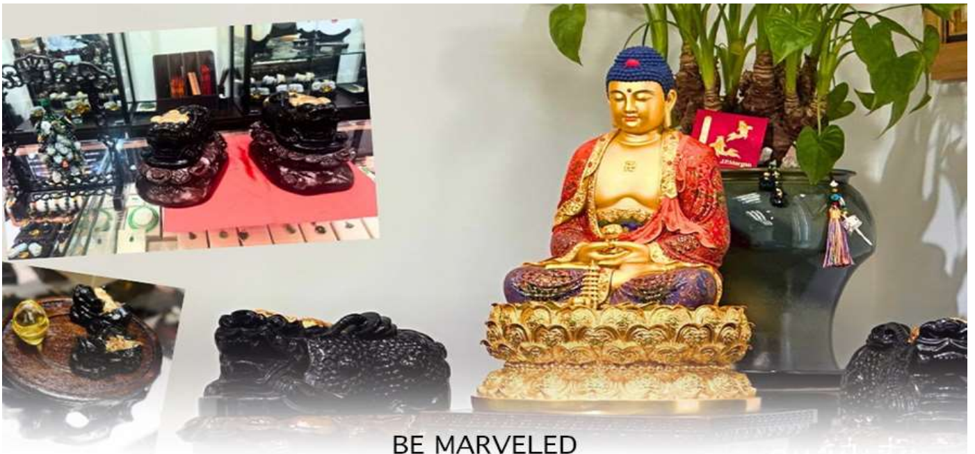
BE MARVELED ศูนย์ปี่เซี่ยะ