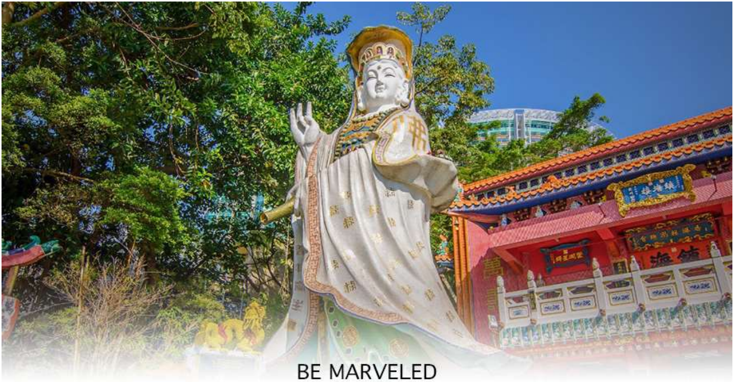
BE MARVELED วัดเจ้าแม่กวนอิมริพลัสเบีย