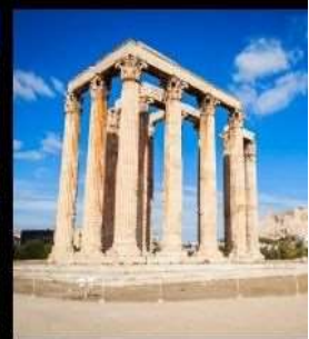
Temple Of Olympian