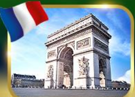
ประตูชัยฝรั่งเศส ปารีส