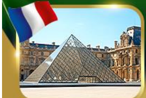
พีพีธกันที่ลูฟวร์ ปารีส