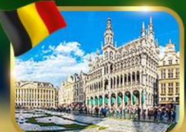
จัตุรัสกรอนด์ ปลาซ บริซเซลส์