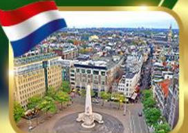
จัตุรัสดีนสแควร์ อัมสเตอร์ดัม