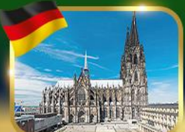
มหาวิหารแห่งเมืองโคโลญ